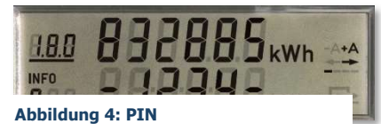
Abbildung 4: PIN

Hinweis: Kurz leuchten Lang leuchten (ca. 5 Sekunden)