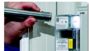
Abbildung 5 : Lichtsensor

Zwei Minuten nach dem letzten Anleuchten zeigt die zweite Displayzeile wieder die Standardanzeige an.