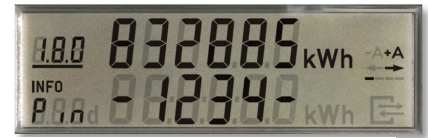
Abbildung 4: PIN

Bitte bewahren Sie Ihre PIN gut auf und geben Sie diese mit dieser Kurzanleitung bei einem Wohnungswechsel an Ihren Nachfolger weiter. Beachten Sie, dass Sie bei einem Wohnungswechsel zum Schutz Ihrer Privatsphäre die Möglichkeit haben, Ihre individuellen Stromverbrauchswerte zu löschen.